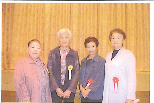
（受賞者のみなさん）