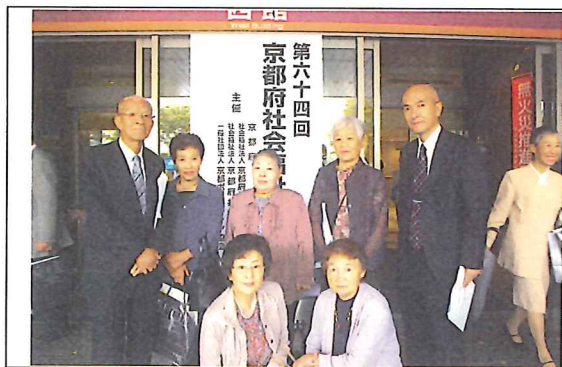
（社会福祉大会会場玄関前にて）