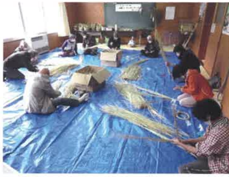
しめ縄づくりスタート！