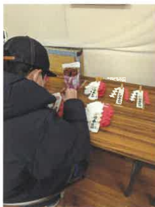
伊根の里でしめ縄に飾りつけをしてもらいました☆

11月に実施した「しめ縄づくり」ボランティア。6日間で延べ57人の方にご協力いただき、目標としていた200本が完成しました。このしめ縄の本体部分はボランティアさん、折り紙の飾りは保育園児、飾り付けと包装は伊根の里の皆さんの手によって、多くの方の「力」をお借りしてできています。皆さま本当にありがとうございました！