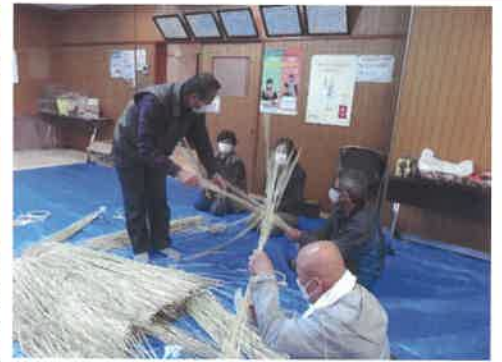
丁寧に教えてもらっています。