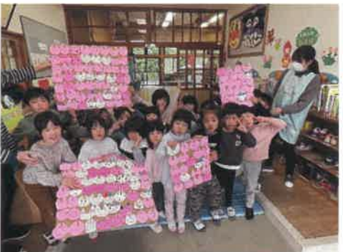
伊根保育園と本庄保育所の子ども達が折り紙でうさぎを作ってくれました♪