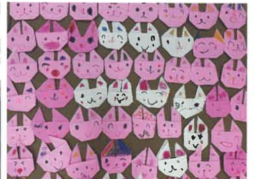
しめ縄につける折り紙のうさぎ。