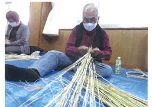
今年から参加して下さった方も、毎年参加して下さる方も、和気あいあいと作業しています♪