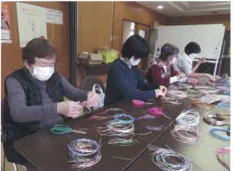
しめ縄につける水引。色の組み合わせに作り手のセンスが光ります☆