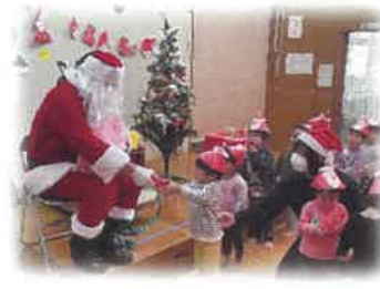
保育園へのサンタクロース訪問活動