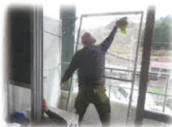
年末掃除サービス