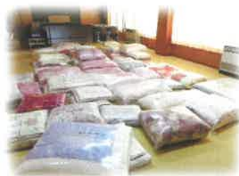
寝具丸洗いサービス