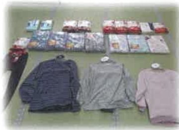
重度要介護者支援サービス