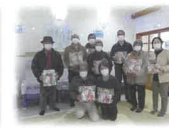
一人暮らし高齢者歳末訪問事業（しめ縄飾りのお届け）訪問ボランティア

他、伊根の里への支援活動・貸出用介護備品整備・未就学児へのサンタクロース訪問活動