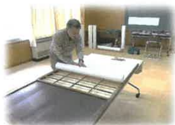
年末障子張りサービス