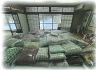
寝具丸洗いサービス