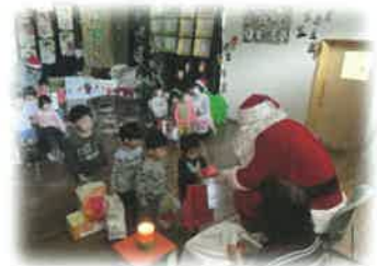
サンタクロース訪問活動

ご寄付ありがとうございました。(令和2年4月から令和3年3月19日現在)合計 1,310,000円