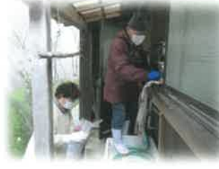
年末掃除サービス