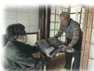
重度要介護者支援サービス