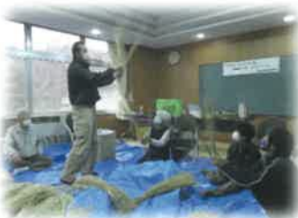
一人暮らし高齢者歳末訪問事業(しめ縄飾りのお届け)