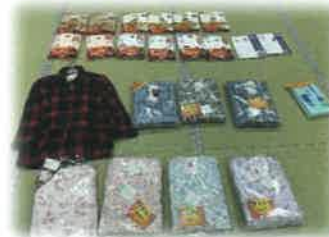
サンタクロース訪問活動