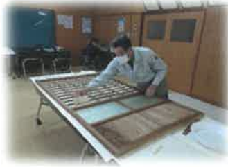
年末障子張りサービス