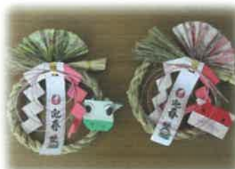
訪問ボランティア