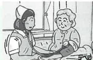
②看護師による健康チェック