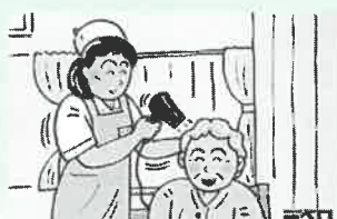
⑧髪もドライヤーで念入りに