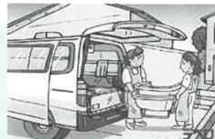
③お部屋へ浴槽運びます