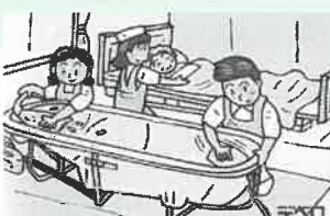
⑦機材は毎回洗浄・消毒します