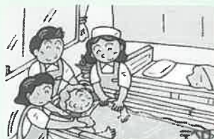
⑤暖かいお湯につかります