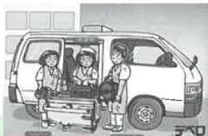
①スタッフ3名で訪問します