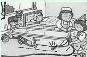
④ホースをつないで準備OK