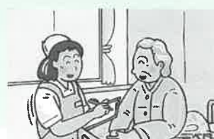
⑨今回もいい湯でしたね