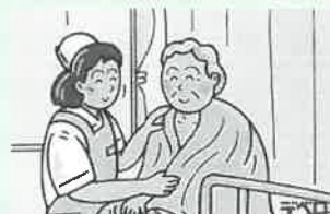
⑥気分爽快リフレッシュ