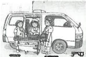
① スタッフ3名で訪問します