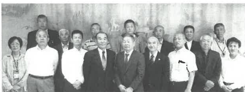
理事、監事の皆さんです

社会福祉法の改正により、全国の社会福祉法人は平成29年4月1日より評議員の任期が一斉にスタートとなり、それに伴い伊根町社会福祉協議会も評議員20名の構成で4年間の任期がスタートいたしました。