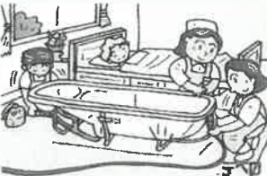
④ ホースをつないで準備OK