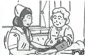
② 看護師による健康チェック