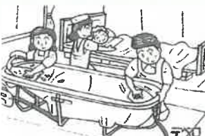
⑦ 機材は毎回洗浄・消毒します