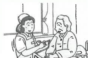
⑨ 今回もいい湯でしたね