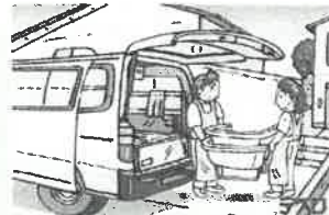
③ お部屋へ浴槽を運びます