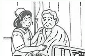
⑥ 気分爽快リフレッシュ