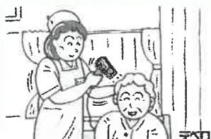
⑧ 髪もドライヤーで念入りに