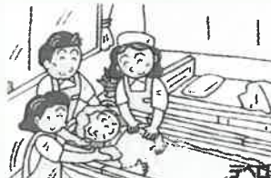
⑤ 暖かいお湯につかります