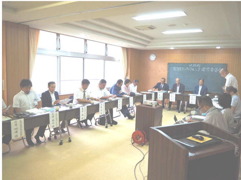
《災害ボランティアセンター運営委員会》

去る9月29日に伊根町社会福祉協議会では、災害が発生し被災された方々への支援について、各関係団体と平常時からの連携と訓練を行い災害時の活動に備えるために「伊根町災害ボランティアセンター運営委員会」を開催しました。